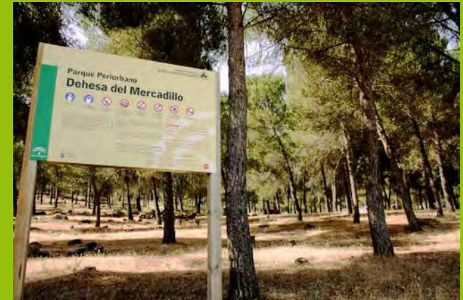
Sendero "Paco Marín"