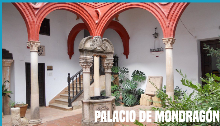
PALACIO DE MONDRAGÓN