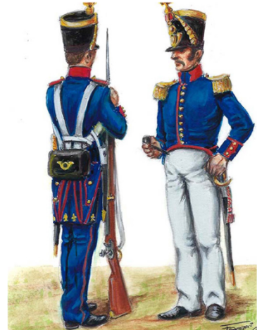
Fusileros del Rey, s.XIX