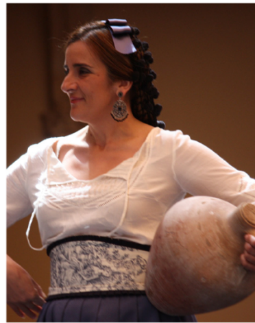
Indumentaria popular rondeña, s.XIX