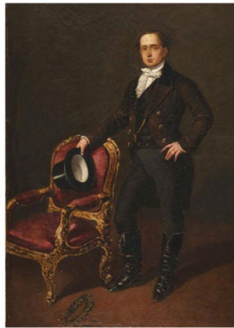
Traje masculino de moda romántica