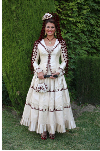
Dama goyesca rondeña