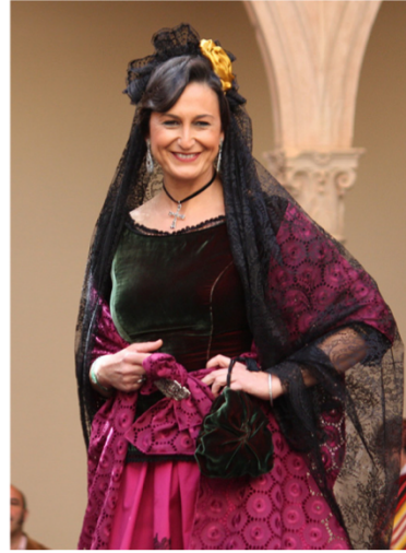
Vestido de maja romántica rondeña