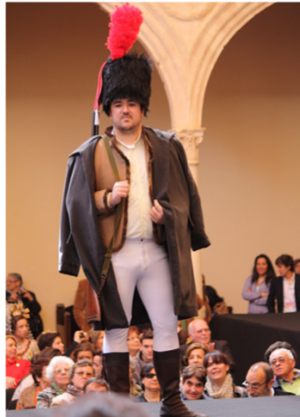
Husar del Ejército Francés, s.XIX