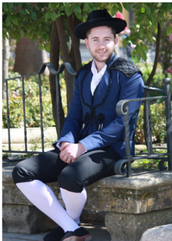
Traje de majo romántico rondeño