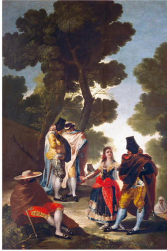
Majos de Goya.