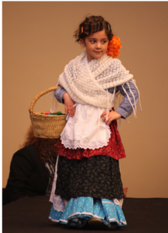
Indumentaria popular infantil, s.XIX