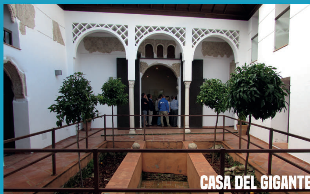
CASA DEL GIGANTE