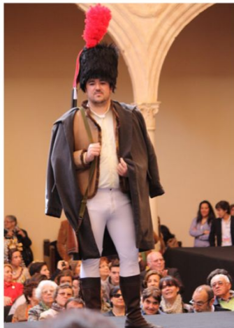
Husar del Ejército Francés, s.XIX