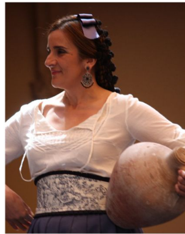
Indumentaria popular ronderña, s.XIX