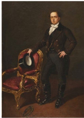
Traje masculino de moda romántica