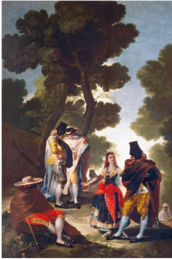
Majos de Goya.