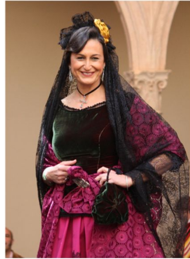
Vestido de maja romántica ronderña