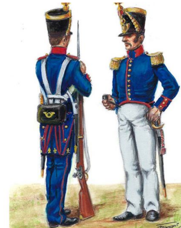
Fusileros del Rey, s.XIX