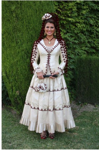
Dama goyesca ronderña