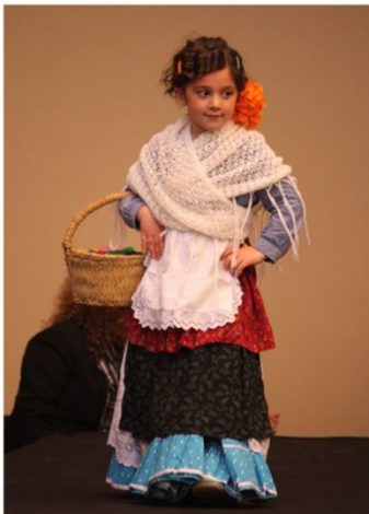
Indumentaria popular infantil, s.XIX